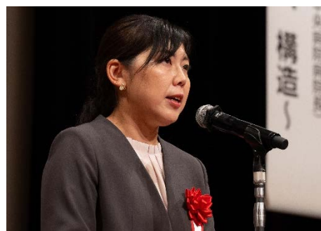
福井県副知事 鷺頭 美央