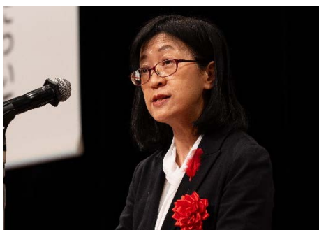
厚生労働省審議官 日原 知己